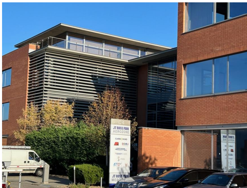
JT Ross Park Aerozone