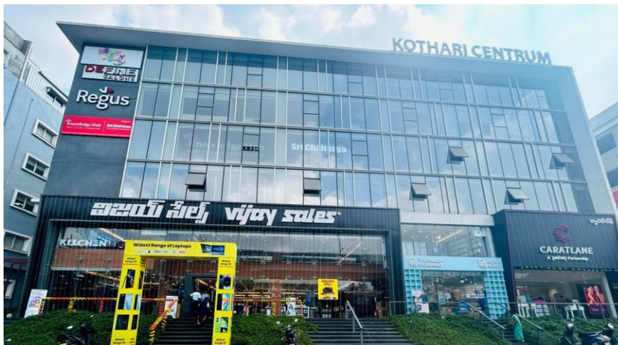
Regus Hyderabad Kothari Centrum