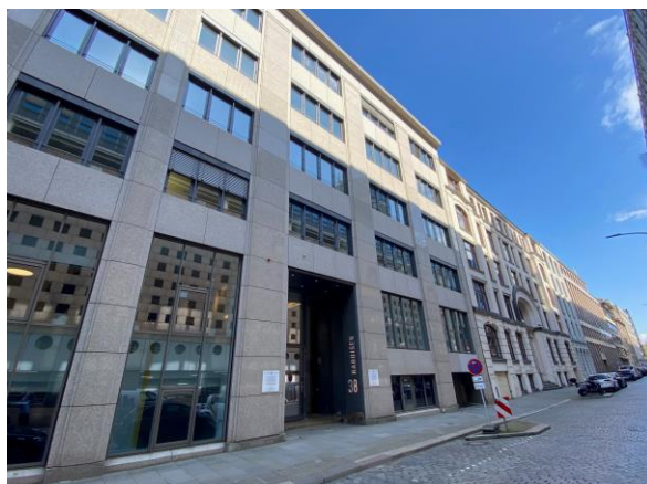
ABC WORK SPACE